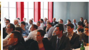
ISSS Security Lunch